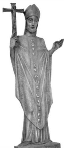
Ludgerusstue in der Ludgerus- kirche an der Potsdamer Straße.

Im Anschluss laden wir alle Mitfeiernden zu einem offenen Gesprächstreffen mit dem Erzbischof in den Pfarrsaal ein.