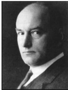
Dr. Erich Klausener