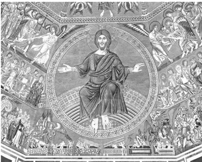
Mosaik "Christus, der Weltenrichter" Baptisterium Florenz

www.st-matthias-berlin.de pfarramt@st-matthias-berlin.de