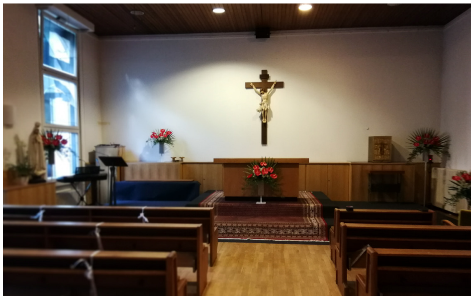
Unser neuer Gottesdienststandort in St. Matthias: Der Pfarrsaal als Kapelle

in St. Norbert. Die Choralschola, Chorissimo, der Kinderchor und der Kirchenchor St. Matthias singen Lieder zur Adventszeit.