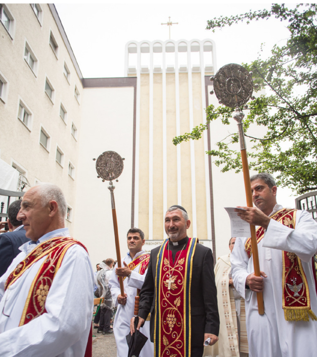
Beginn der Fronleichnamsprozession

und zeigt uns so: Leben heißt sich geben; denn Gott tut es selbst. Ein kleines Wort aus der zweiten Lesung aus dem Hebräerbrief sollten wir einmal aufgreifen: „Kraft ewigen Geistes“ (Hebr 9,14). Jesus hat sich