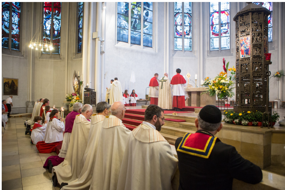
Abschluss der Fronleichnamsprozession in der St. Matthias-Kirche