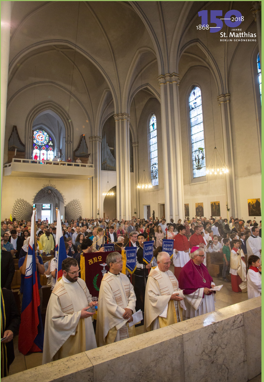
Abschluss der Fronleichnamsprozession 2018

150 — 2018 1868 — JAHRE St. Matthias BERLIN-SCHÖNEBERG