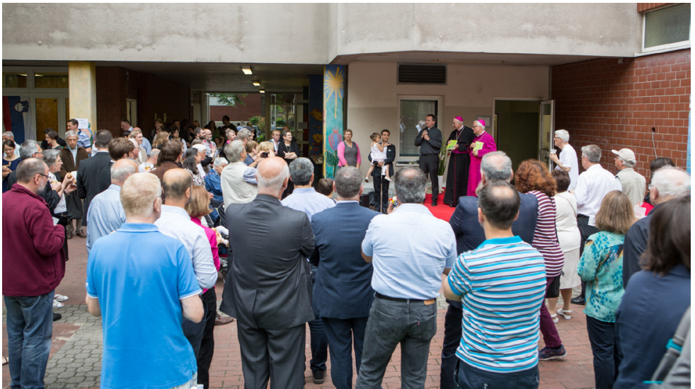
Vorstellung der Festschrift „FEST IM GLAUBEN“