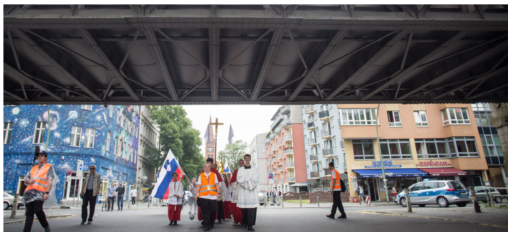
Die Fronleichnamsprozession auf den Straßen Schönebergs

Wenn wir über Gemeindeerneuerung nachdenken, wie Sie das im Rahmen des 150-jährigen Jubiläums in St. Matthias tun, dann schauen wir auf Jesus, der eben nicht Gebäude und Strukturen erhalten will. Verstehen Sie das nicht falsch – Gott sei Dank wird diese Kirche renoviert! Die versammelte Gemeinde braucht einen Ort, der würdig und schön ist und von ansprechender Einfachheit, an dem die Liebe Gottes erfahrbar wird, wo Menschen Wärme