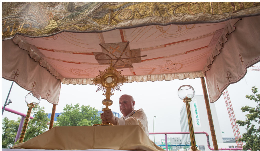
Christus am sozialen Brennpunkt: erste Station in der Kurfürstenstraße

heiligsten, damit sie Kraft hatte, dem Leib Christi in den Ärmsten der Armen zu begegnen. Eine Cousine von Bischof Clemens August war Maria Droste zu Vischering. Eine ganz tiefe Herz-Jesu-Verehrung zeichnete sie aus. Gleichzeitig gab sie ihr Leben für die Ärmsten der Armen als Schwester vom Guten Hirten in Portugal. Wie viele Beispiele könnten Sie aus Ihrem Leben erzählen, und wie viele Beispiele sind auch Sie! - Tut dies zu Seinem Gedächtnis! Blut ist Leben, Leben heißt sich geben; denn Gott steht im Bund mit uns. So konkret liebt er. Lasst uns das feiern, uns zu Herzen nehmen und uns aussenden lassen zu den Menschen – dort, wo wir leben und besonders hier in unserer Stadt. Dafür tragen wir den Herrn jetzt auf die Straße, weil wir unser Leben den anderen geben möchten, wie Er es getan hat. Amen.