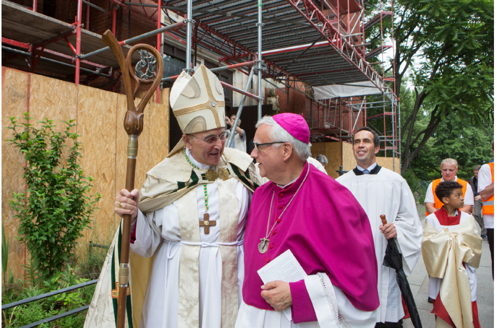
Bischof Felix Genn und Erzbischof Heiner Koch nach der Fronleichnamsprozession