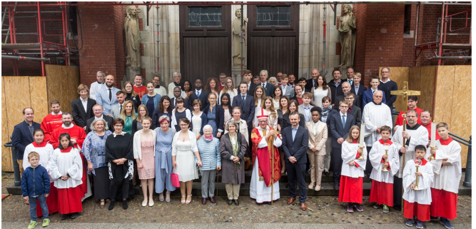
Die Firmlinge mit Erzbischof Heiner Koch