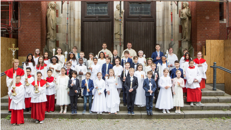
43 Kinder gingen in diesem Jahr zur Erstkommunion