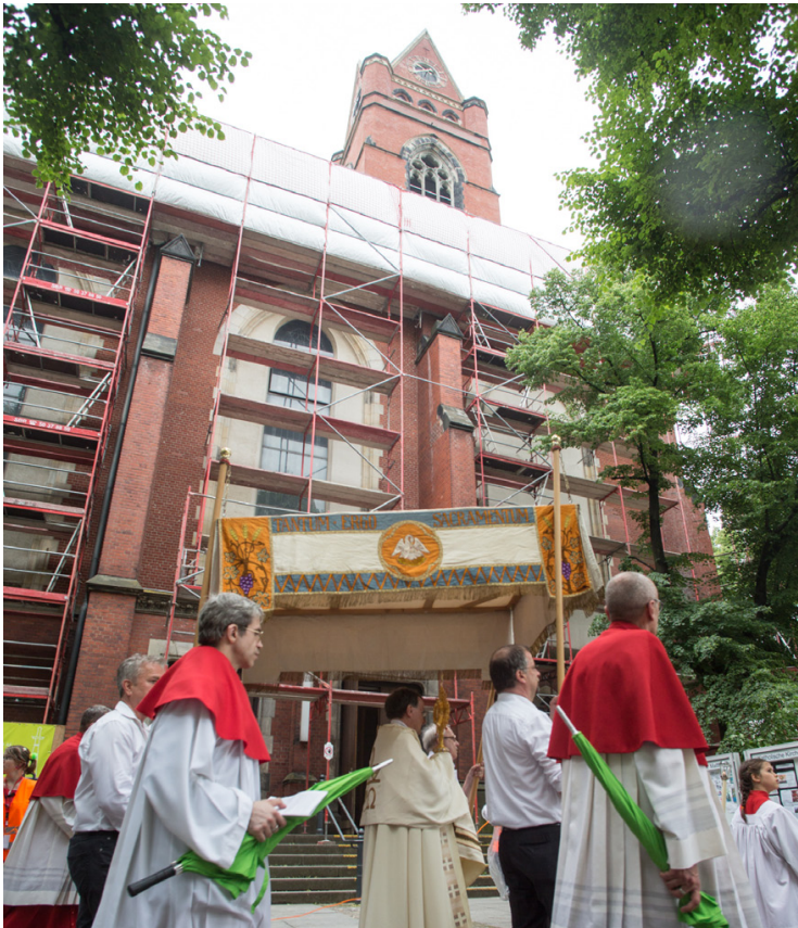
Die Fronleichnamspirozession vor der eingerüsteten Kirche