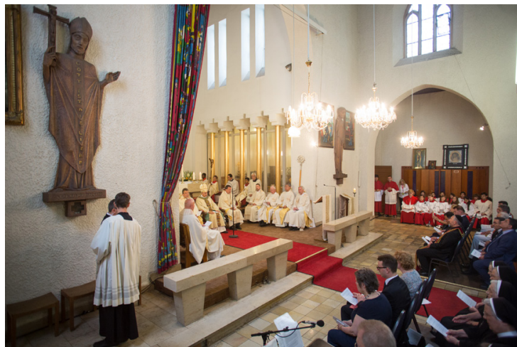
Beginn des Hochfestes des Leibes und Blutes Christi in der ursprünglichen St. Matthias-Kirche, heute Mor Jakob, in der Potsdamer Straße

Die Bilder in dieser Ausgabe dokumentieren die Feiern zum 150-jährigen Jubiläum unserer Gemeinde und den Beginn der Baumaßnahmen zur Renovierung und Verschönerung unserer Kirche auf dem Winterfeldtplatz.