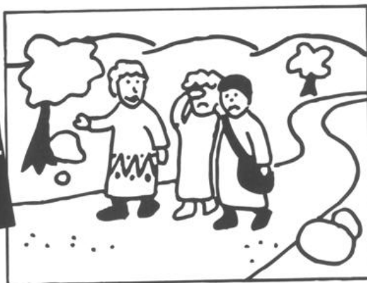
Lukas 24, 13-35