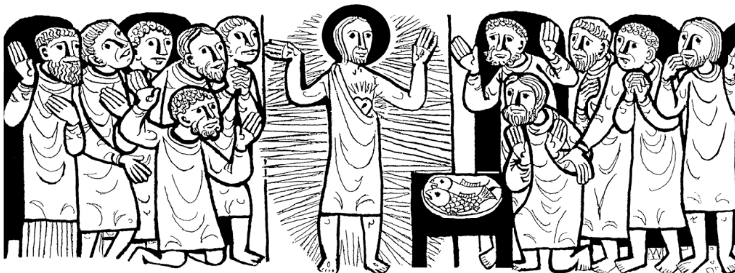
3. Sonntag der Osterzeit, Lk 24, 35-48