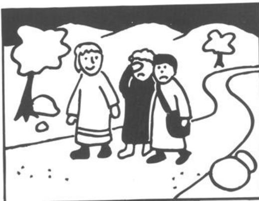
Lösung: Das Bild rechts unten.