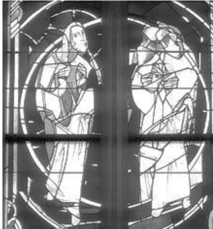
Das mittlere Chorfenster hinter dem Altar zeigt die Verklärung des Herrn

„Herr, es ist gut, dass wir hier sind“ – Der verklärte Herr in unserer Mitte mit Moses und Elija (Mt 17,1-9)