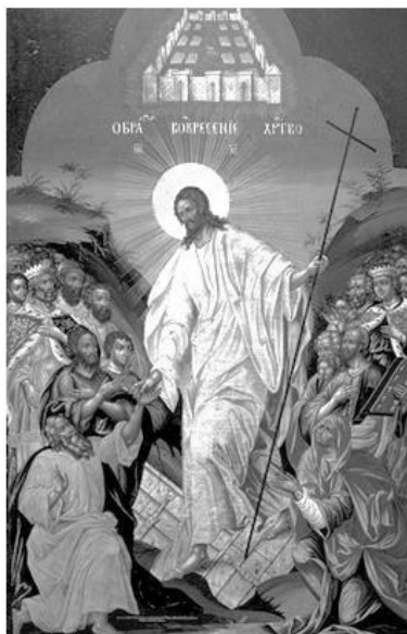
Original von Yegory Ivanov Grek, 1749